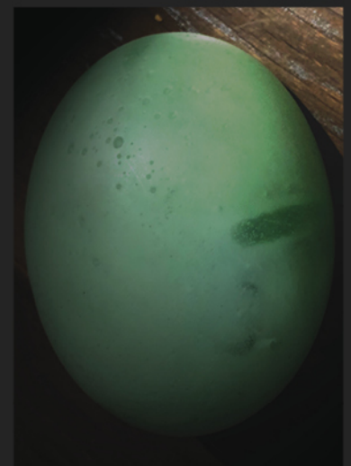
Fig. 6 - Lanterne harmonique, étude No 2 (Chambord). Plus petite et compacte, la lanterne évoque le croisement entre un galet et un œuf de salamandre. La communication entre la lanterne et le casque d'écoute est à présent sans fil. Le contrôle de volume est sur l'oreillette droite du casque.

L'installation requiert théoriquement quatre antennes pour chacun des sous-espaces couverts par l'installation. Le nombre total d'antennes requises dépend toutefois étroitement des matériaux des parois et de la configuration des espaces. Il doit être déterminé par des tests préalables.