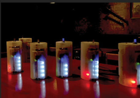
Fig. 4 - Lanternes harmoniques, première étude (Mende). Le seul contrôle est un bouton de volume.