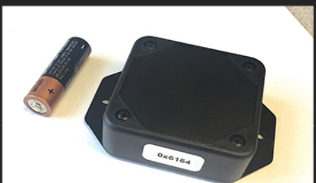
Fig. 5 - Balise UWB pour la géolocalisation à haute résolution des visiteurs. Le boîtier ne mesure que quelques centimètres (65 x 65 x 20 mm).

Les visiteurs et leurs lanternes harmoniques sont localisés à chaque instant dans l'édifice par l'entremise d'un système de positionnement par réseau WiFi à ultra-large bande (UWB), un équipement qui possède de multiples avantages. La localisation s'effectue avec une résolution de 10 cm. Le système n'est pas perturbé par les interférences d'ondes parasites, telles que celles émises par les téléphones intelligents.