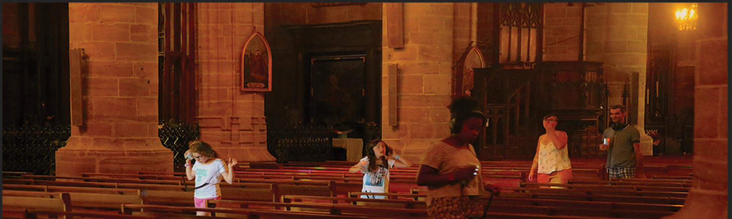
Fig. 1, 2 et 3 - Cathédrale de Mende, 2017. Par sa simplicité d'utilisation, l'installation est accessible aux visiteurs de tous les âges et de toutes les origines (en haut). Ci-dessus, visite par un groupe